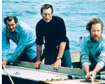
1973 LES DENTS DE LA MER (Jaws) de Steven Spielberg avec Robert Shaw, R. Dreyfuss