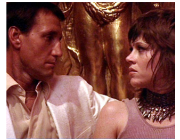
1970 INSPECTEUR KLUTE (Klute) de Alan J. Pakula avec Jane Fonda