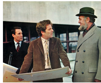
1970 INDIFÉLITÉ (Loving) d'Irvin Kershner avec George Segal, Sterling Hayden