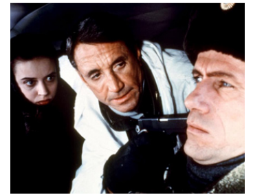
1989 LA QUATRIÈME GUERRE (The Fourth War) de J. Frankenheimer avec Lara Harris, J. Prochnow