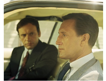
1972 UN HOMME EST MORT de Jacques Deray avec Jean-Louis Trintignant