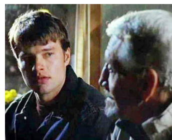
2007 DARK HONEYMOON de David O'Malley avec Nick Cornish