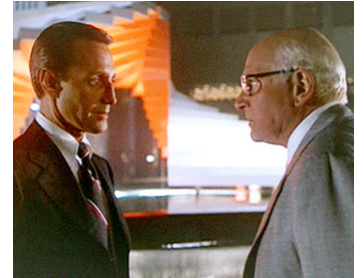
1975 MARATHON MAN (Marathon Man) de John Schlesinger avec Laurence Olivier