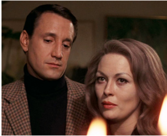
1970 PORTRAIT D'UNE ENFANT DÉCHUE (Puzzle of a Dawfall Child) de J. Schatzberg