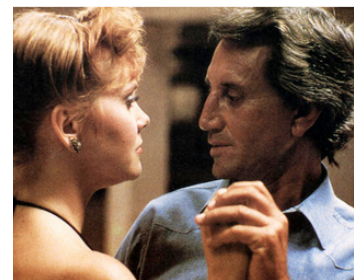
1986 MEN'S CLUB (The Men's Club) de Peter Medak avec Ann Dusenberry