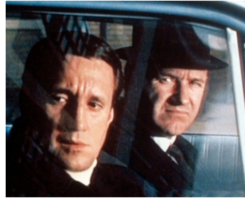
1971 FRENCH CONNECTION (French Connection) de William Friedkin avec Gene Hackman