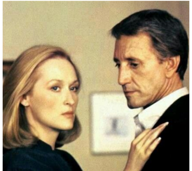
1981 LA MORT AUX ENCHÈRES (Still of the Night) de Robert Benton avec Meryl Streep