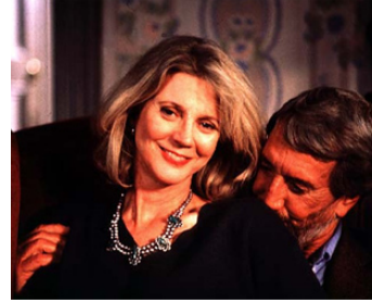
1996 BACK HOME (The Myth of Fingerprints) de Bert Freundlich avec Blythe Danner