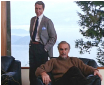
1990 LA MAISON RUSSIE (The Russia House) de Fred Schepisi avec Sean Connery