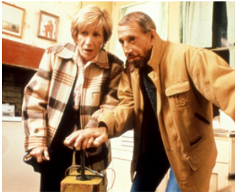
1998 BETTER LIVING (Better Living) de Max Mayer avec Olympia Dukakis