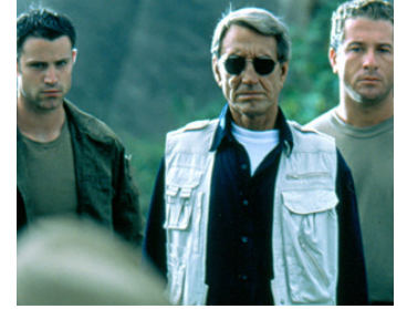
1997 LA FUITE DE PLATO (Plato's Run) de James Becket avec Channing Tatum, Steven Bauer