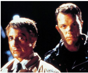
1988 COHEN ET TATE (Cohen and Tate) de Eric Red avec Adam Baldwin