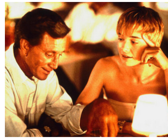
1989 NIGHT GAME de Peter Masterson avec Karen Young