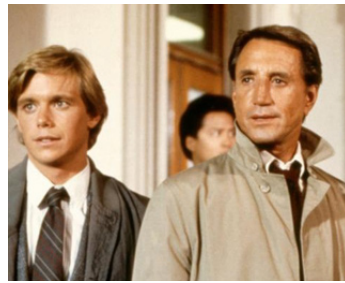
1988 LISTEN TO ME de Douglas Day Stewart avec Chris Atkins