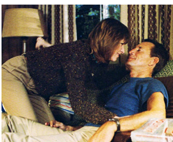
1982 TONNERRE DE FEU (Blue Thunder) de John Badham avec Candy Clark