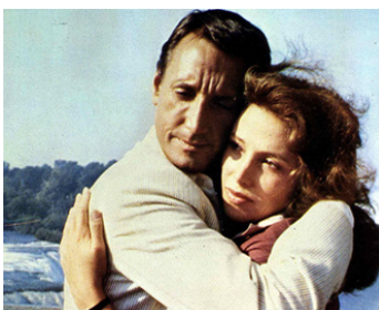
1978 MEURTRES EN CASCADE (Last Embrace) de Jonathan Demme avec Janet Margolin