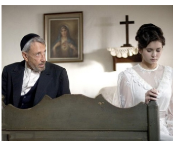
2006 OPÉRATION VARSOVIE (The Poet) de Damian Lee avec Nina Dobрева