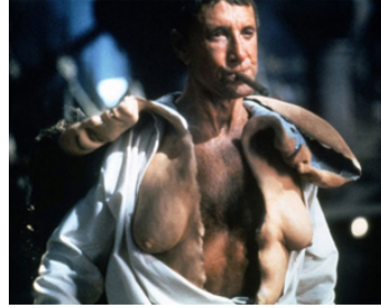
1991 LE FESTIN NU (Naked Lunch) de David Cronenberg