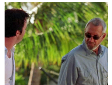
2004 PUNISHER, LES LIENS DE SANG (The Punisher) de J. Hensley avec Thomas Jane