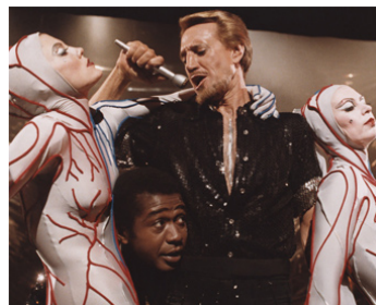
1979 QUE LE SPECTACLE COMMENCE (All that Jazz) de Bob Fosse avec Ben Vereen