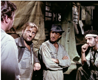
1976 LE CONVOI DE LA PEUR (The Sorcerer) de William Friedkin avec Bruno Crémer