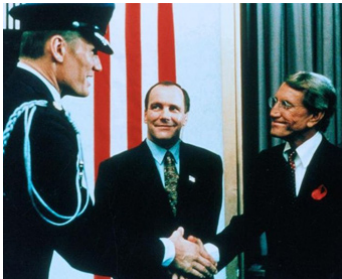
1997 ÉTAT D'URGENCE (The Peacekeeper) de Fr. Forester avec Dolph Lundgren, W. Harrelson