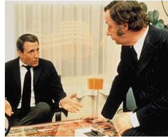
1972 L'ATTENTAT d'Yves Boisset avec Philippe Noiret