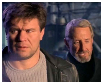
2001 LE SERPENT ROUGE (Red Serpent) de Gino Tanasescu avec Oleg Taktarov