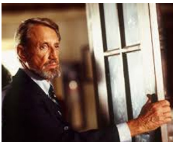
2000 LES ANGES NE DORMENT PAS (Angels don't sleep here) de Paul Cade