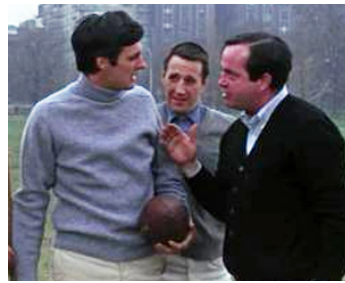
1968 THE PAPER LION d'Alex March avec Alan Alda, David Doyle