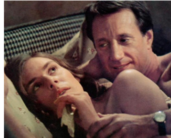
1974 SHEILA LEVINE IS DEAD AND LIVING IN NEW YORK de S. Furie avec Jeannie Berlin