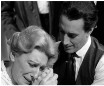
1964 THE CURSE OF THE LIVING CORPSE de Del Tenney avec Helen Warren