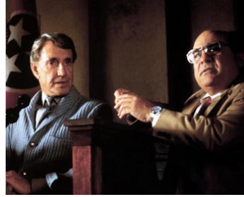
1997 L'IDÉALISTE (The Rainmaker) de Francis Ford Coppola avec Danny De Vito