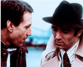
1973 POLICE PUISSANCE 7 (The Seven ups) de Philip D'Antoni avec Victor Arnold