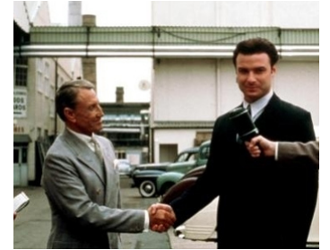
2000 CITIZEN WELLES (RKO 281) de Benjamin Ross avec Liev Schreiber