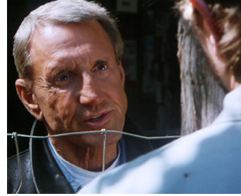
1998 LE LOUP ARGENTÉ (Silver Wolf) de Peter Svatek avec Michal Biehn