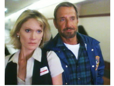
1998 SÉCURITÉ MAXIMUM (Evasive Action) de Jerry P. Jacobs avec DeLane Matthews