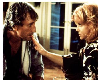
1985 PAIEMENT CASH (52 Pick-up) de John Frankenheimer avec Ann-Margret