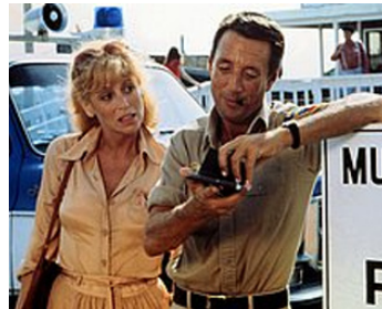
1977 LES DENTS DE LA MER 2 (Jaws 2) de Janot Szwarc avec Lorraine Gary